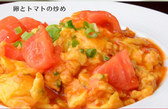
卵とトマトの炒め