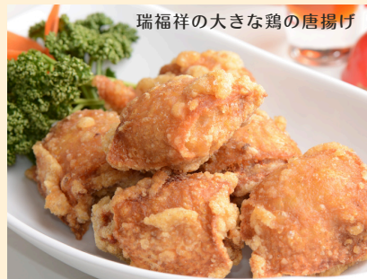
瑞福祥の大きな鶏の唐揚げ