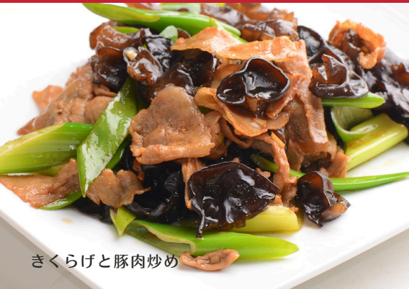
きくらげと豚肉炒め