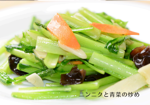
ニンニクと青菜の炒め